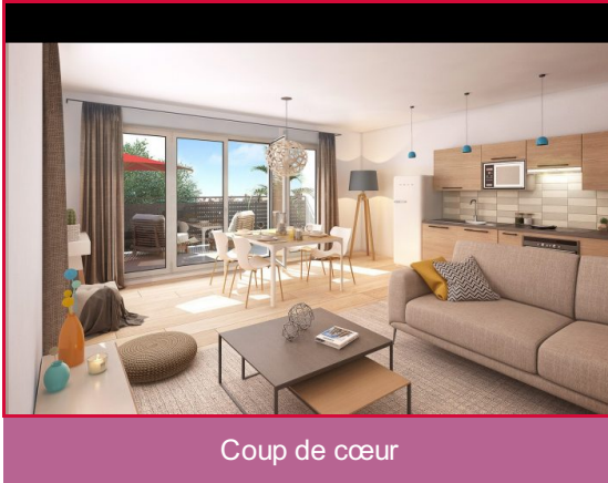
Coup de cœur

Référence VA1039 Située dans le quartier du Fer à Cheval, et à 200 mètres à peine de la limite nord de celui de Croix de Pierre, la résidence bénéficie d'un cadre de vie réunissant beaucoup d'avantages. À moins de 200 mètres, la résidence est desservie par 4 lignes de bus ainsi que 2 stations de tramway, la connectant directement au centre-ville de Toulouse ou à l'aéroport.